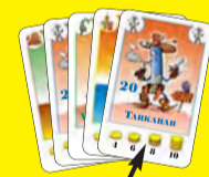
Ez az első lap!