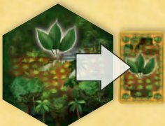
Az őserdő – ültetvény koka kereskedelmi árut termel.