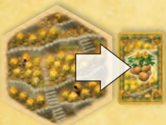
A szántó föld burgonya nyersanyagot termel.