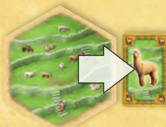
A legelő gyajú nyersanyagot termel.