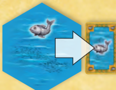
A part menti víz hal kereskedelmi árut termel.