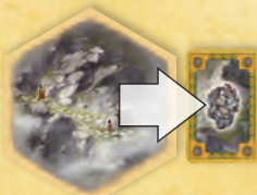
A hegység érc nyersanyagot termel.