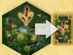
Az őserdő toll kereskedelmi árut termel.