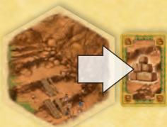
A kőfejtő kő nyersanyagot termel.