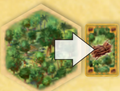
Az erdő fa nyersanyagot termel.